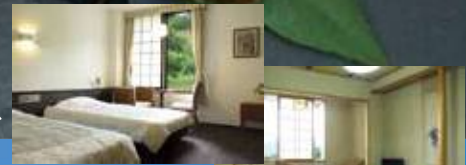
ホテル三陽客室例

1日目 13:00 一ノ関駅西口発 ⇒ 両替漁港工場見学、牡蠣のお話(60分) ⇒ 気仙大工左官伝承館(60分) ⇒ ホテル三陽 (夕食・宿泊)