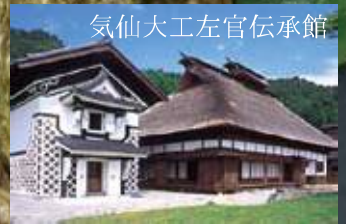
気仙大工左官伝承館