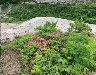
地獄釜～須川高原温泉