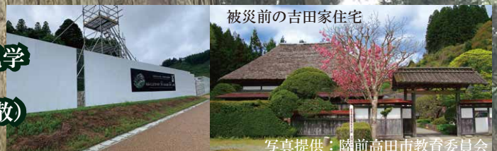
被災前の吉田家住宅