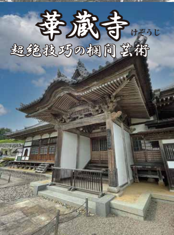
華蔵寺 けぞうじ 超絶技巧の欄間芸術