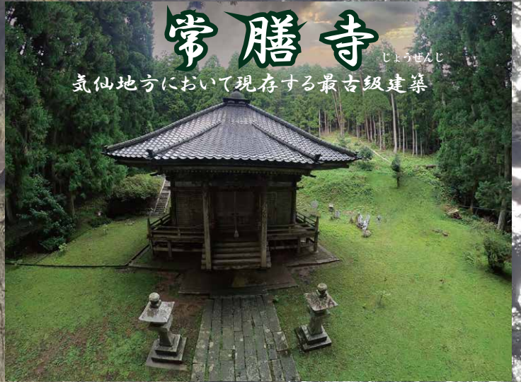
常膳寺 じょうぜんじ 気仙地方において現存する最古級建築